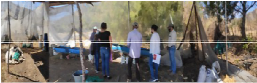
Imagen 2. Biofábrica en CAC Jonacatepec, Morelos, México