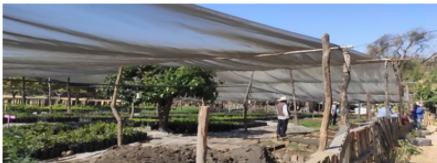
Imagen 3. CAC en Yecapixtla, Morelos, México