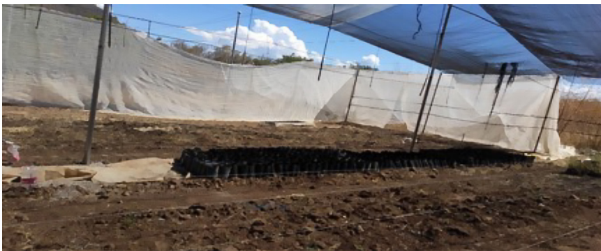
Imagen 1. CAC en Jonacatepec, Morelos, México