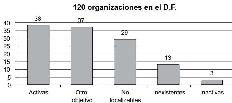
Gráfica 1 Universo de organizaciones del VIH-SIDA en el Distrito Federal

Así, son 38 las OC mexicanas dedicadas exclusivamente o principalmente al trabajo en VIH-SIDA en el Distrito Federal activas y localizables en 2006.